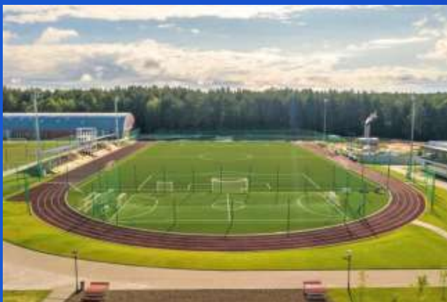
ОСНОВНОЕ ФУТБОЛЬНОЕ ПОЛЕ