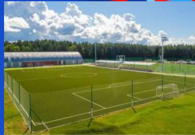
ТРЕНИРОВОЧНОЕ ФУТБОЛЬНОЕ ПОЛЕ